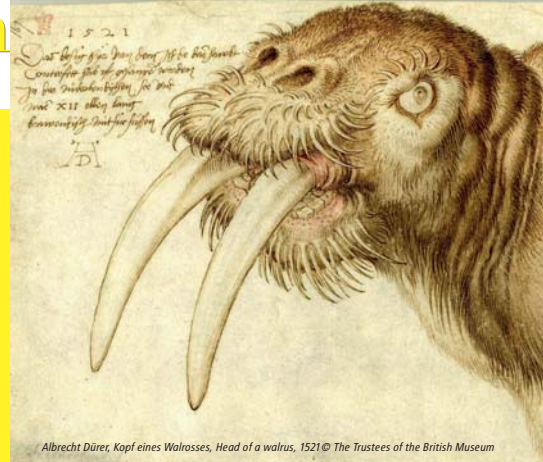
Albrecht Dürer, Kopf eines Walrosses, Head of a walrus, 1521 © The Trustees of the British Museum

Johannes-Paul-II.-Straße 1 | 52058 Aachen | Tel.: +49 241 432-4998 museumsdienst@mail.aachen.de