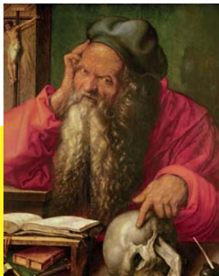
Albrecht Dürer, Hl. Hieronymus, Saint Jerome, 1521 © Museu Nacional de Arte Antiga, Lissabon | Photo © Selva / Bridgeman

Wilhelmstraße 18 | 52070 Aachen | www.suermondt-ludwig-museum.de