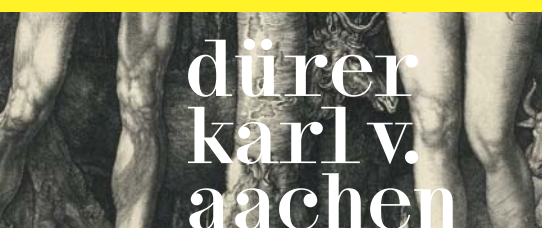
Albrecht Dürer, Adam und Eva, Adam and Eve, 1504, Rijksmuseum Amsterdam

In 1520, two important historical figures journeyed to Aachen: Charles V, who was to be ceremonially crowned in Aachen Cathedral; and Albrecht Dürer, one of the greatest artists of his time. Dürer wanted to persuade the freshly crowned monarch to renew the imperial privileges the artist had forfeited.