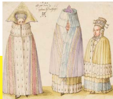
Albrecht Dürer, Drei Frauen aus Livonia in Winterkleidung, Three women from Livonia in winter clothes, 1521

Katschhof 1 | 52062 Aachen | www.centre-charlemagne.eu