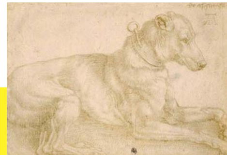
Albrecht Dürer, Rastender Hund, Resting dog, 1520

Jülicher Straße 97 – 109 | 52070 Aachen | www.ludwigforum.de